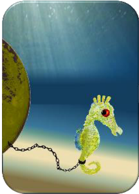
Abb. 00 a