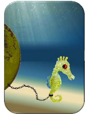
Abb. 00 c

Erfahren Sie, wie es dazu kommt UND wie wir künftig diesen Irrsinn gemeinsam verhindern können: