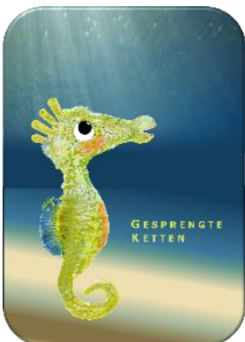
Abb. 00 b

gefolterte Seepferdchen und das Perpetuum mobile des Grauens